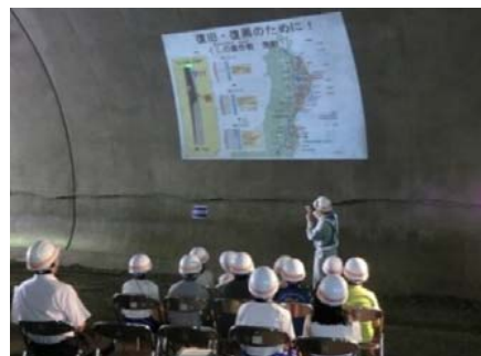
整備効果について学ぶ児童たち

8月26日(金)、宮古市立藤原小学校の5年生11名が総合的な学習の一環で「命の道をつくる」をテーマに学習するため工事現場を見学しました。はじめに、(仮)小山田トンネルにおいて「宮古箱石道路」の整備効果や千徳小山田道路工事の概要について説明を受け、災害時に「命」を救う道路の役割やその道路が作られていく過程を学びながら見学しました。