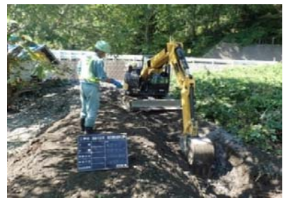
岡村地区において、法面崩壊箇所の土砂上げ