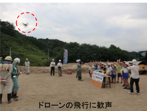
ドローンの飛行に歓声