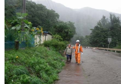
箱石、岡村地区で地域住民の避難誘導を実施