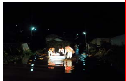
浸水被害地で、地域住民をポートにより救出し安全な場所へ搬送