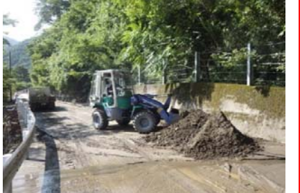
腹帯地区において市道へ流出した土砂の撤去