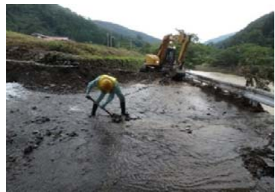
箱石地区において市道へ流出した土砂の撤去