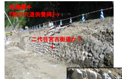
昔の宮古街道の石積み護岸 河原の玉石を空積みで築き上げている

残念ながらこの石積みは、応急復旧の完了に伴い再び地中に眠ることとなりましたが、再び見ることとなった時は宮古市の一大事の可能性がある高いので、今後見る機会が無いことを祈っています。