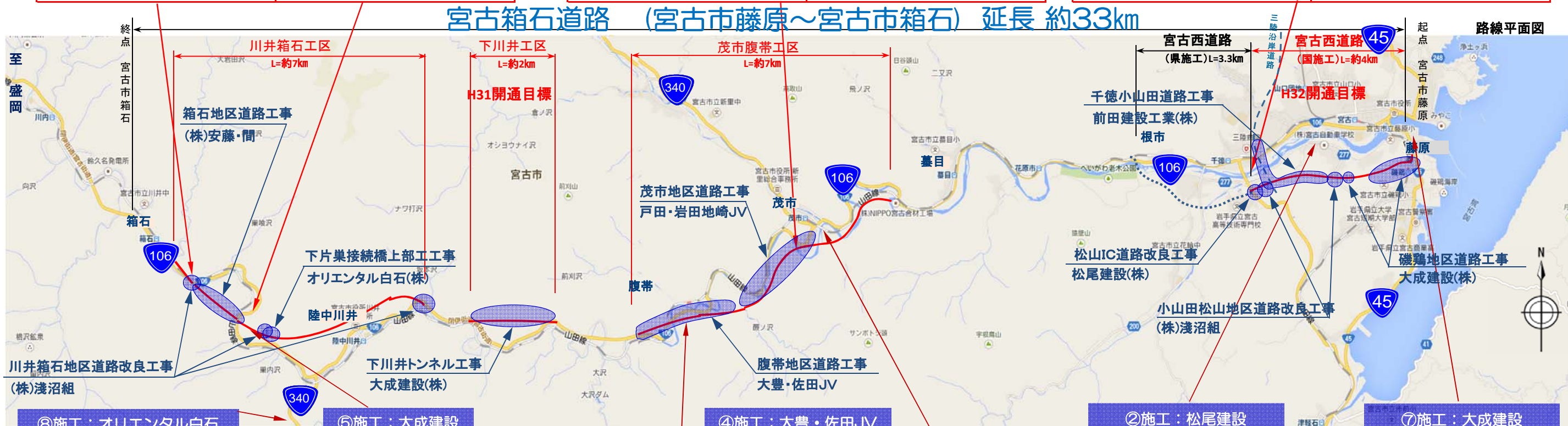
⑧施工：オリエンタル白石