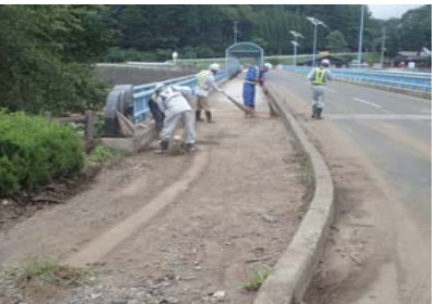
湯ったり館進入道路へ流出した土砂を撤去