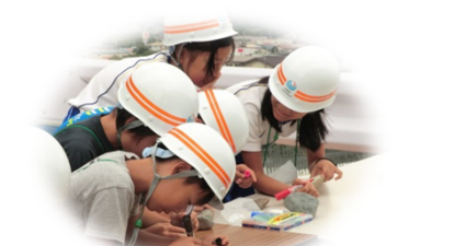
下部工に使う石に願い事を書く児童たち。どんな願い事かな...