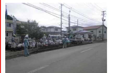
宮古市内において、県道宮古港線へ流出した土砂の撤去