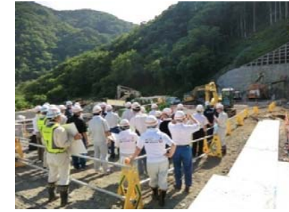
(仮)腹帯第3トンネル工事現場