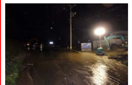
木戸井内川へ流出した土砂を撤去