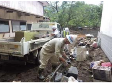
茂市地区において家庭から発生した災害ごみの集積運搬のお手伝い