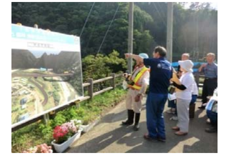
茂市地区道路工事現場