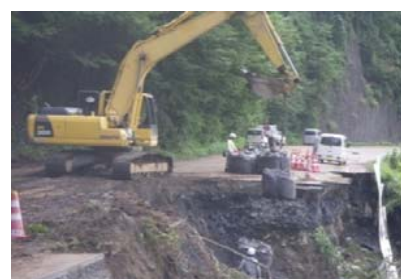
国道340号崩壊箇所で、大型土のう設置及び交通誘導に協力