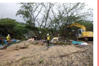
閑伊川へ流出したごみを撤去