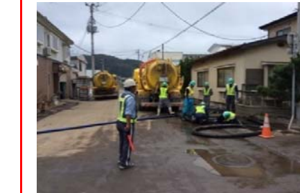
藤原地区において側溝に詰まった土砂をバキューム車で撤去